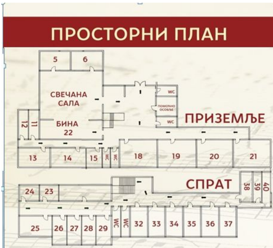
Површина наставног простора