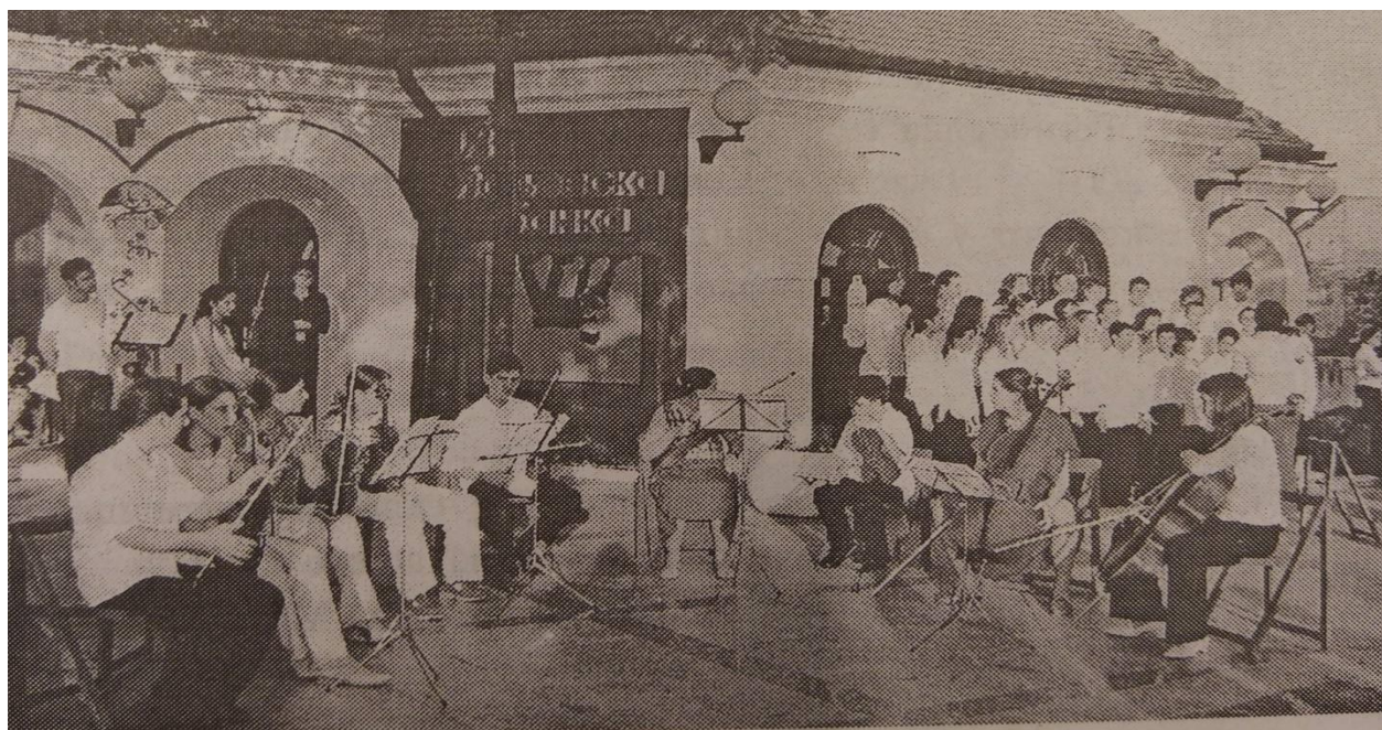
„Ода музици” – концерт на Тргу Живојина Мишића