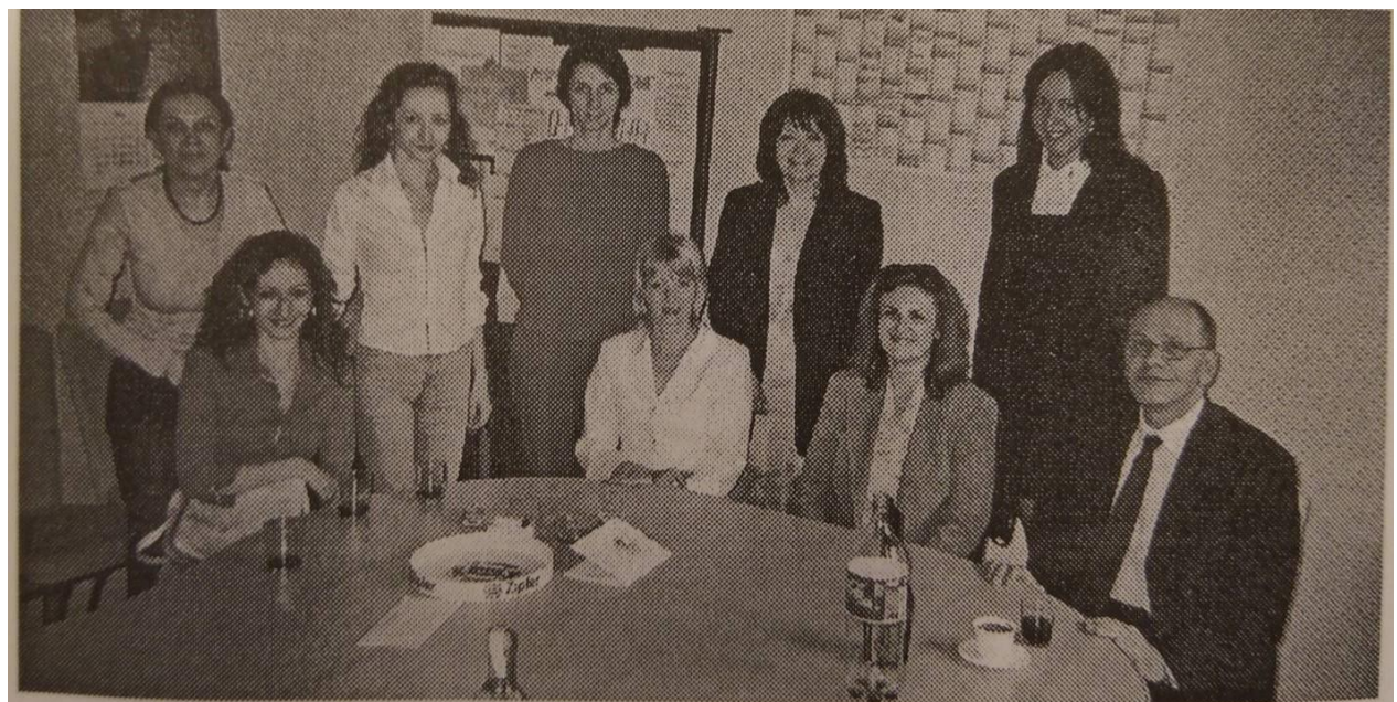
Део колектива Музичке школе „Живорад Грбић”