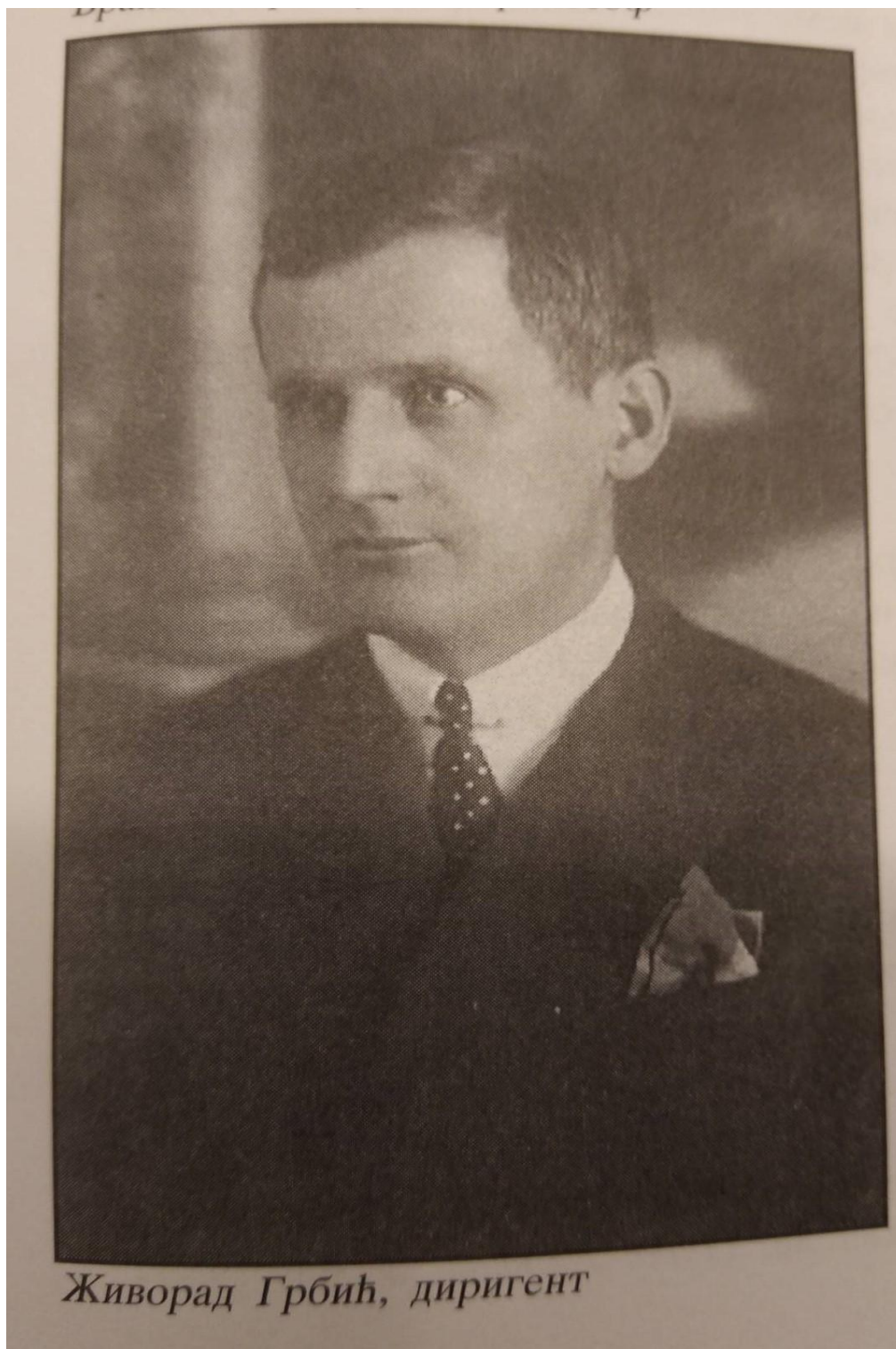
Живорад Грбић, диригент